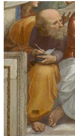
Anaxímenes (585-4 a. C. – 528-4 a. C.)