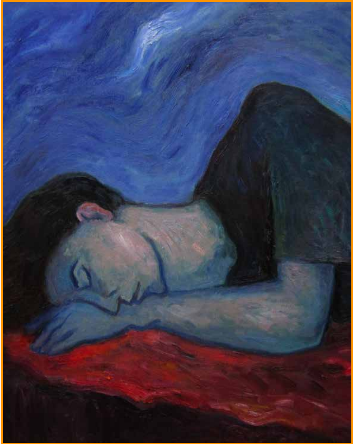
El sueño. Óleo sobre tela (100 x 81 cm).