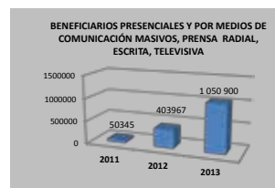
El Programa ha llegado a más de un millón de personas desde el 2011.