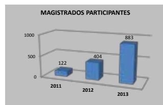
El 40% de los jueces del Poder Judicial son miembros del Programa.