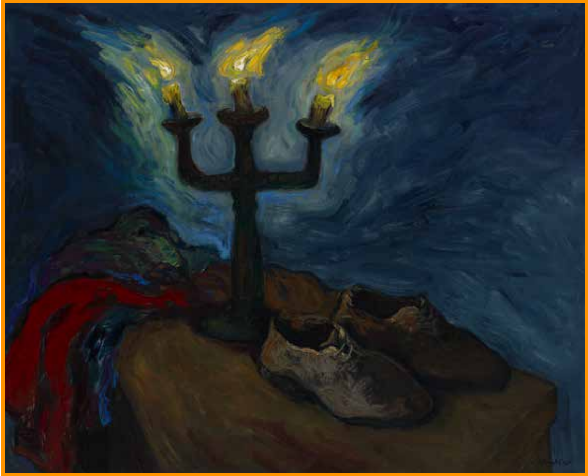
Candelabro. Óleo sobre tela (200 x 210 cm).