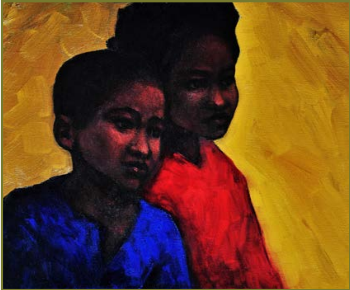
Fraternidad. Óleo sobre lienzo, 125 x 214 cm. Diego Alcalde, artista plástico peruano (Lima, Perú 1986) https://www.instagram.com/diegoalcaldeart/?hl=es