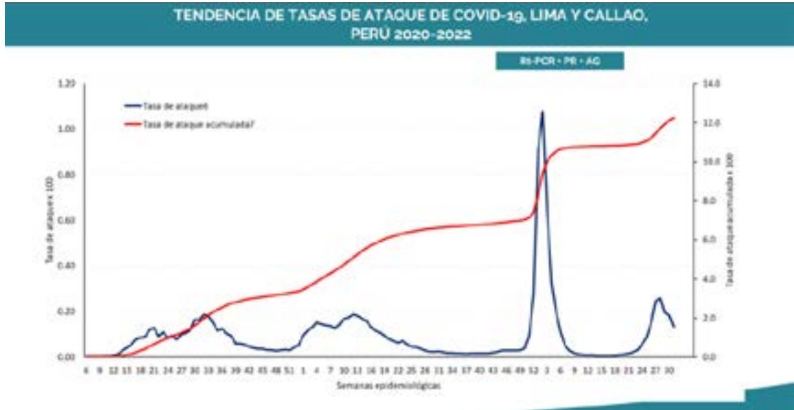
Gráfico 3.