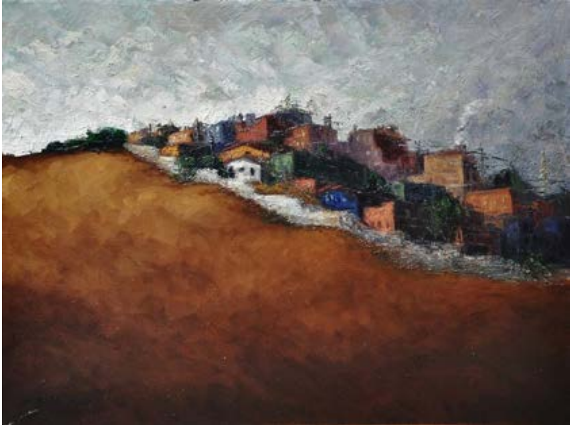
Paisaje peruano. Óleo sobre lienzo, 60 x 80 cm. Diego Alcalde, artista plástico peruano (Lima, Perú 1986) https://www.instagram.com/diegoalcaldeart/?hl=es