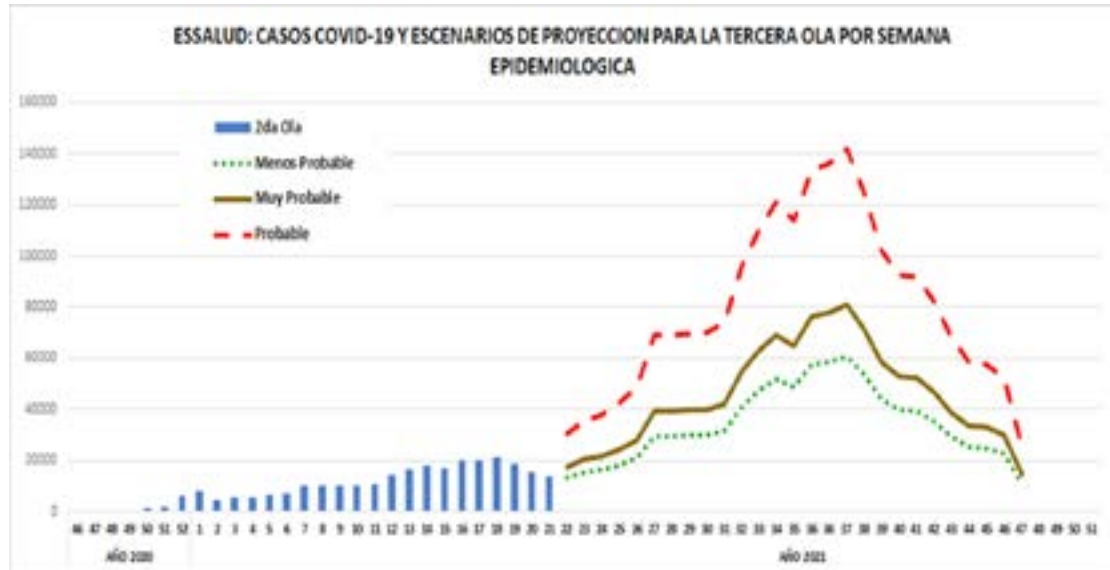
Gráfico 1.