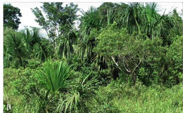
Figura N° 4. Hábitat típico de ACR Imiría, Moravec et al. ‘17

El estudio de Moravec (2) ubique sus puntos en el norte extremo de ACR Imiría en áreas debajo mucho presión por uso agrícola del paisaje. Mientras ninguna variación de cobertura de bosque estaba notado, este bosque se toca las orillas de la Laguna Imiría. Por eso las cifras de Moravec (2) representan un acercamiento para entender el sistema de humedales en Imiría—calificado como un sistema único en Ucayali. La diversidad en el género Osteocephalus implica la posibilidad del uso de la variedad de hábitats presentes en el sistema de este grupo muy complejo de ranas arbícolas (20, 21).