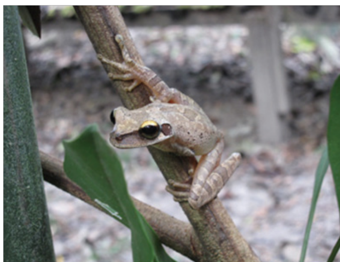
Figura N° 5. Osteocephalus castaenicola – parte del complejo sin registro en Ucayali