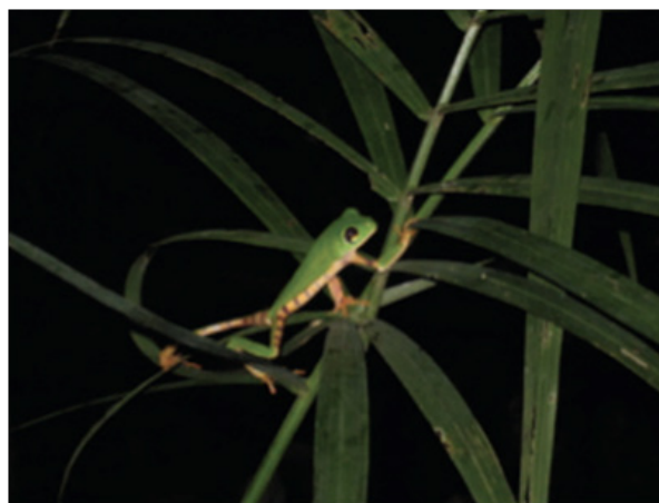
Figura N° 6. Corallus batesi y Calimedusa tomopterna