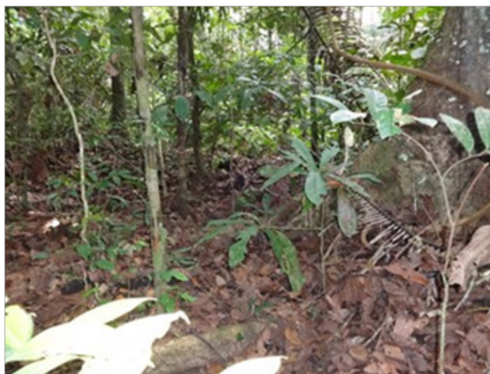
Figura N° 2. Bosque de San Mateo

Se ubica la Comunidad Nativa Santa Rosa de Tamaya Tipishca en las orillas del dicho cuerpo del agua, que esta afluente de los ríos Abujao y Tamaya. Se encuentra regularmente las zonas de bosque de inundación estacional de las llanuras meandricas o “tahuampas”. Este tipos de bosque normalmente es bajo en diversidad, pero los poblaciones de anfibios están mucho más productivas en cantidades (18, 19).