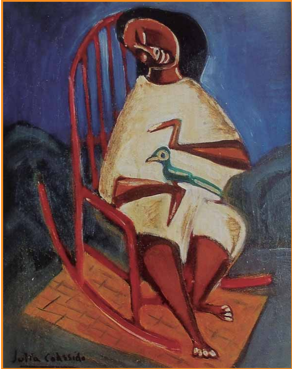
Ave azul. Colección particular.