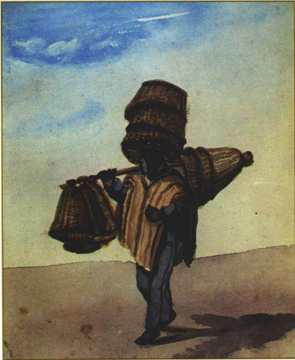
Vendedor de canastas.