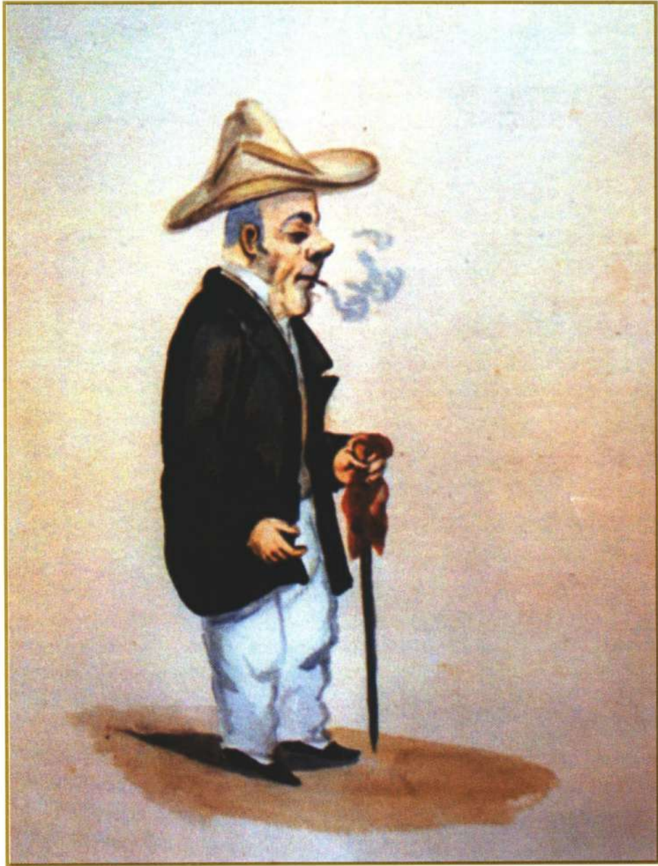
Personaje de la época "Ño Bofetada".