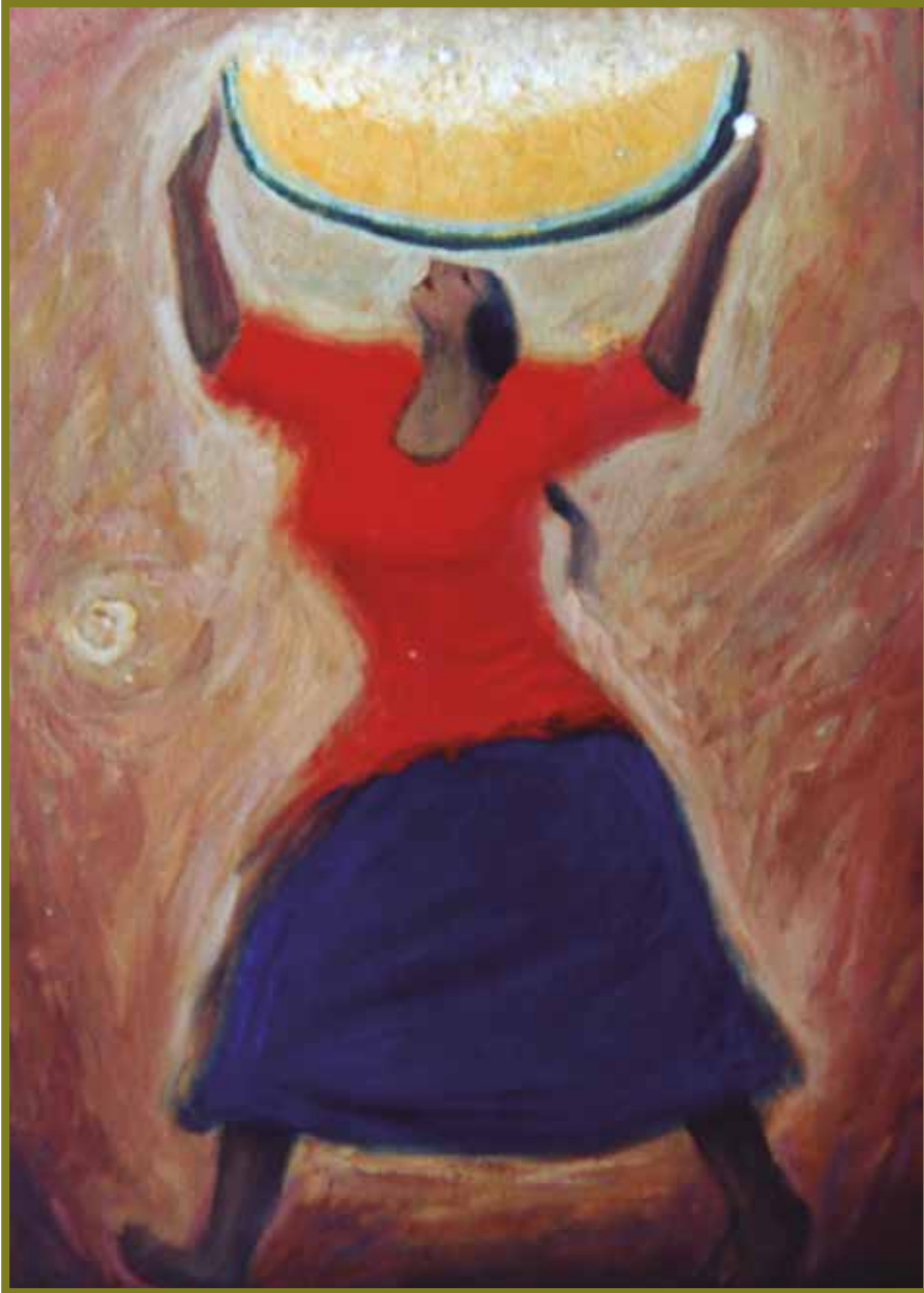
Mujer con zapallo. Óscar Allain