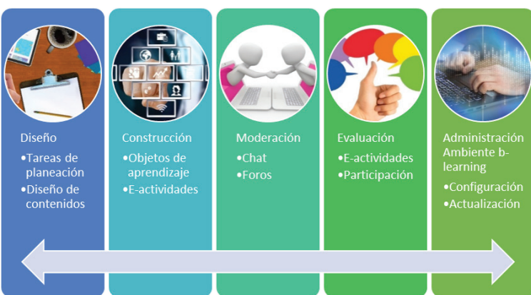
Figura 2 Presencia Docente en la propuesta pedagógica Fuente: Elaboración propia. Imágenes de uso gratuito (Pixabay)

La presencia docente en la propuesta pedagógica desarrollada para el proyecto “Promoción del trabajo colaborativo a través de la integración de objetos de aprendizaje en ambientes virtuales” (KENTA, 2009), buscó articular los roles y funciones para mantener la motivación de los estudiantes, analizar sus aportes y promover la reflexión con el propósito de orientar, enriquecer y realimentar el proceso de enseñanza – aprendizaje al realizarse trabajo colaborativo diseñando una serie de hechos desencadenantes. La Figura 2 presenta en forma general los roles del docente en la propuesta desarrollada.