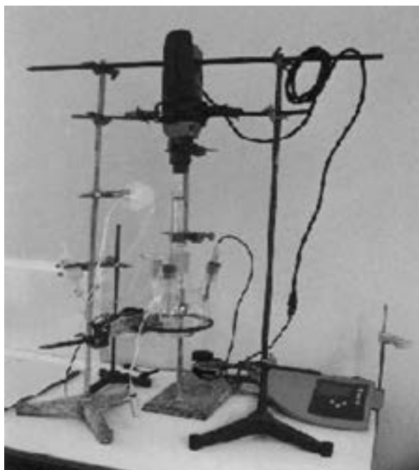
Figura 1. Fotografía del biorreactor utilizado.

Biorreactor de 1 000 ml de capacidad construido por el autor, el mismo que se muestra en la figura 1, con su respectivo esquema en la figura 2.